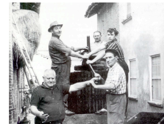
VENDEMMIA - MIRADOLO TERME La torchiatura del mosto

NEL TERRITORIO DELLA BASSA PAVESE SORGEVANO DIVERSI MULINI ALCUNI DEI QUALI ERANO COLLOCATI SUL FIUME PO