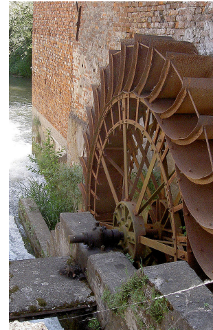
VECCHIO MULINO CORTEOLONA MULINO DI MEZZA VIA

NEL TERRITORIO DELLA BASSA PAVESE SORGEVANO DIVERSI MULINI ALCUNI DEI QUALI ERANO COLLOCATI SUL FIUME PO